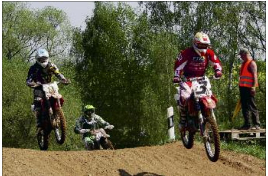
Zum Auftakt der Flöha-Pokal-Serie 2012 drehten im Vogeltal Flöha die Piloten in insgesamt 14 Klassen (hier ein Foto der Hobbyklasse), an den Gasgriffen.

155 eingeschriebene Fahrer, damit wurden die Erwartungen mehr als erfüllt. „Wir hatten heute kaum eine ruhige Minute, und das war gut so“, strahlte MCF-Chef Rico Näther. Da die Strecke im Vogeltal auf Grund der hohen Temperaturen und der damit verbundenen starken Staubentwicklung immer wieder gewässert werden musste, geriet die Veranstaltung in enormen Zeitverzug. Immer wieder lautete für die Helfer der Befehl „Wasser marsch!“, um die Auswirkungen der Trockenheit einzudämmen sowie die Sicherheit der Fahrer zu gewährleisten. „Aber sonst lief alles wie erhofft“, betonte Näther. In der Lizenzklasse stand nach zwei Umläufen Roy-Jack Mende aus Neuhausen auf dem Podest ganz