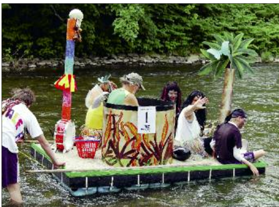
Warm paddeln zum diesjährigen 20. Flusspiratentreffen oder noch schnell anmelden unter www.flusspiratentreffen.de .

20. Auflage des Flusspiratentreffens mit 3 tollen Tagen