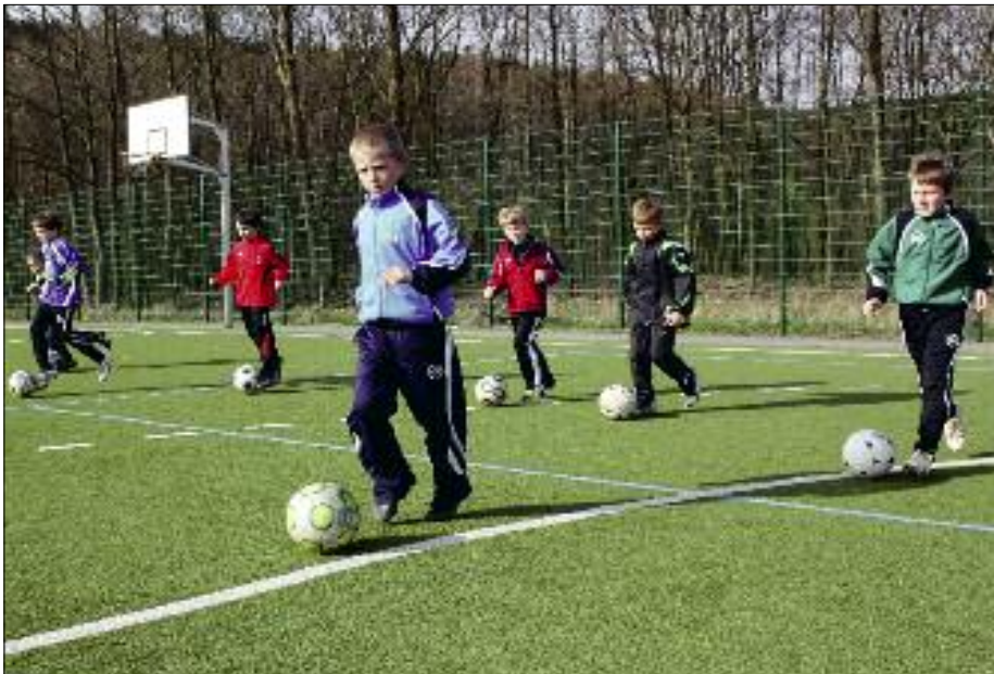
Während der Osterferien trainierten viele junge Kicker im Fußballcamp des Nachwuchsfördervereins.