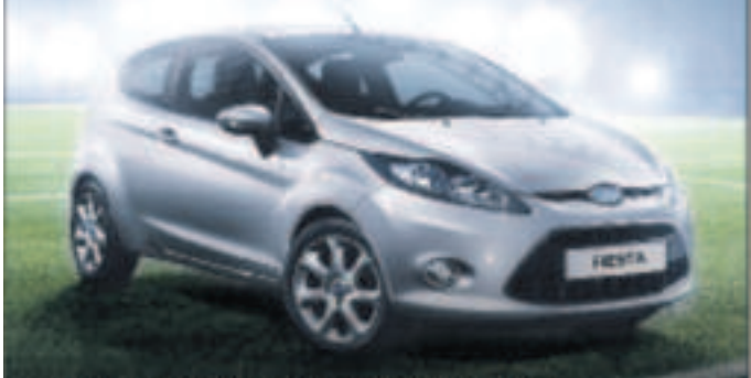
Abbildung zeigt Wunschausstattung gegen Mehrpreis.

NUR BIS 30.09.! DER FORD FIESTA CHAMPIONS EDITION JETZT FÜR '9.990,- 2