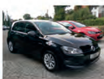
VW Golf 1.4 TSI 92 kW (125 PS)