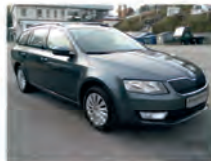
Skoda Octavia Combi 2.0 TDI 110 kW (150 PS)