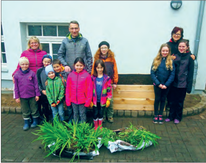
Auch Oberbürgermeister Volker Holuscha besuchte zum Frühjahrsputz an der Grundschule „Friedrich Schiller“ die fleißigen Helfer.

Am 08.04.17 trafen sich mehr als 150 Kinder und Erwachsene zum 12. Einsatz auf dem Schulgelände. Wir erhielten vom