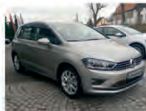
VW Golf Sportvan 1.4 TSI 92 kW (125 PS)