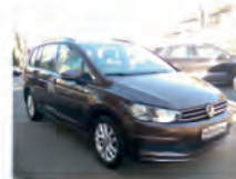
VW Touran 1.4 TSI 110 kW (150 PS)