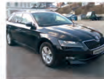
Skoda Superb Combi 2.0 TDI 140 kW (190 PS)