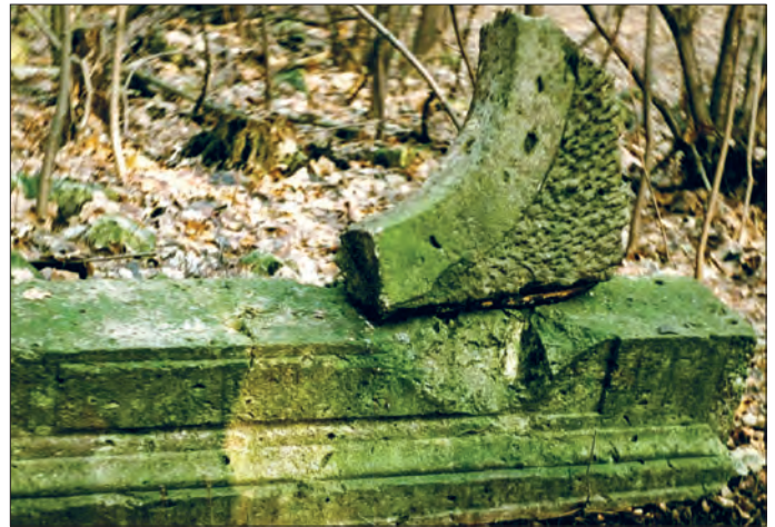
Reste eines Türstocks und eines Rundfenstergewändes aus Tuff im Tuffbruch Gückelsberg 1992.

* Quarzporphyrtuff, auch Porphyrtuff oder nur Tuff genannt. Die neuere Bezeichnung ist Rhyolithtuff