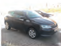
Skoda Fabia 1.2 TSI 66 kW (90 PS)