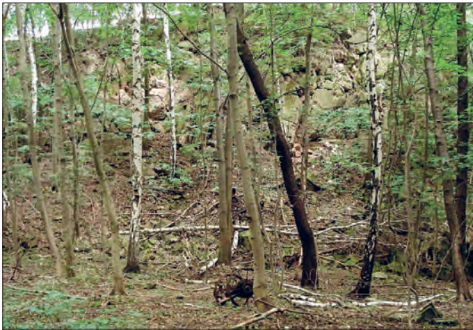
Tuffbruch Gückelsberg: Im größten Flöhaer Porphyrtuffbruch baute man vor 1815 bis 1910 Tuff ab.

Zwischen Falkenau und Oederan gibt es außer dem an der B 173 gelegenen großen Tuffbruch nördlich der B 173 im Oederaner Wald auf 1,2 km Ost-West-Länge Schürfgräben mit Abbau-