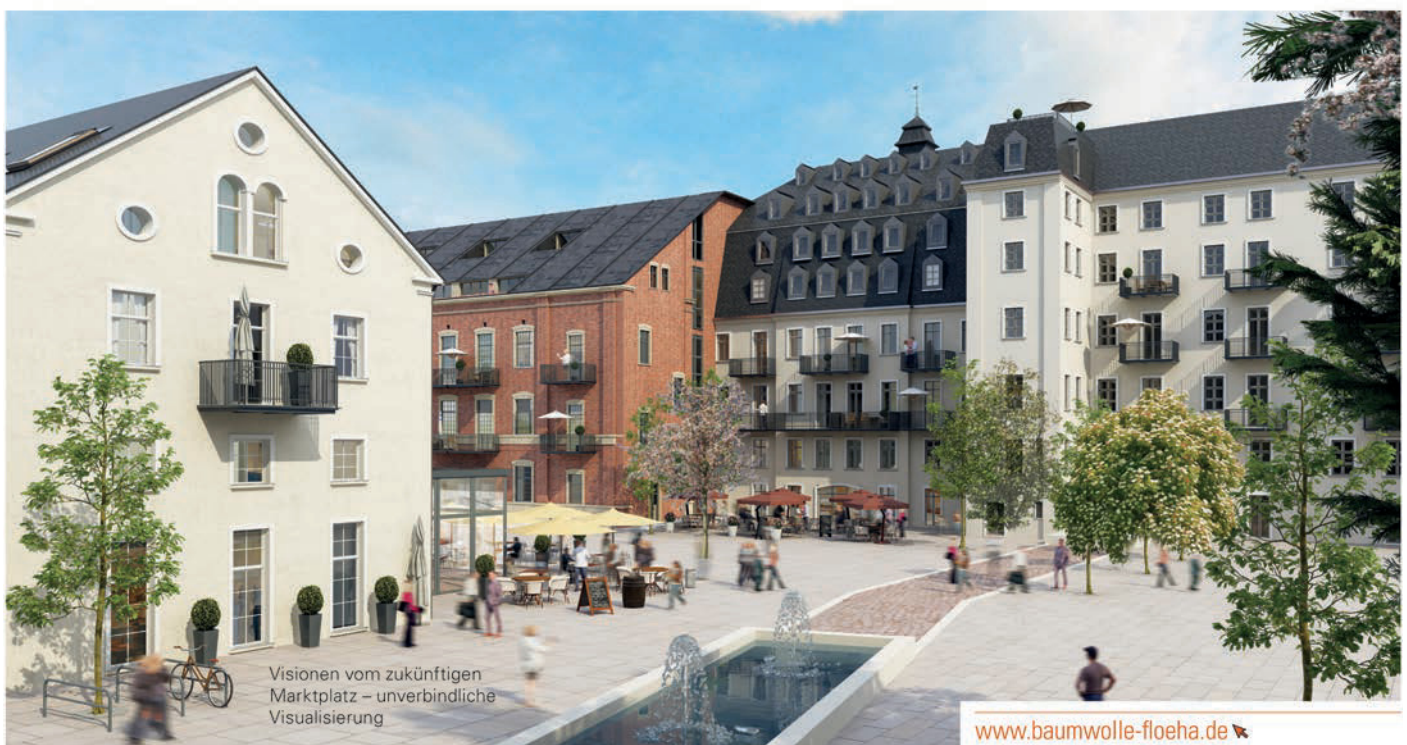
Visionen vom zukünftigen Marktplatz – unverbindliche Visualisierung

schwärmt Architekt Jürgen Wischniewski. „Wir werden die ursprüngliche Dachform des Walmdachs wieder aufnehmen und haben für die Wohnungen sehr individuelle Grundrisse entwickelt.“ Ein Großteil der Wohnungen wird barrierefrei sein. Highlights sind Loggien und Balkone mit Blick auf Schloss Augustusburg. Zudem werden den Bewohnern der Altbauten künftig zwei möblierte Gästewohnungen für ihre Besucher gegen eine kleine Nutzungspauschale zur Verfügung stehen. „Der Baubeginn im Gaubenhaus ist für Frühjahr 2021 geplant“, blickt Bauleiter Lutz Brandt voraus. „Dann können die Baufirmen, die bis dahin im Klinkerbau am Werk sind, ihre Arbeit im benachbarten Haus fortsetzen.“ Für das gesamte Projekt „Alte Baumwolle“ setzt Ticoncept verstärkt auf Arbeitskräfte aus der Region: Aktuell werden zum Beispiel noch Trockenbau-Monteur und Bau-Hilfskräfte gesucht. „Bei Interesse bitte einfach eine E-Mail an info@ticoncept.de schicken“, so Bauleiter Lutz Brandt. „Oder Sie sprechen mich direkt auf der Baustelle an.“