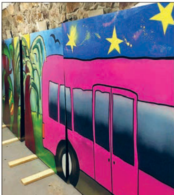
Teilansicht einer Platte, die zukünftig ein Flöhaer Buswartehäuschen zieren wird.

Endlich war es soweit, am 24. September gestalteten 5 Schülerinnen und 2 Schüler aus den 10. Klassen gemeinsam mit dem Künstler Jens Ossada die Graffiti-Platten für ein Buswartehäuschen in Flöha. Eigentlich wäre das bereits im März geschehen, damals fiel es leider Corona bedingt aus.