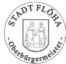
Holuscha Oberbürgermeister Große Kreisstadt Flöha