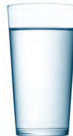
Der Mensch kann nur 4 Tage ohne Flüssigkeit auskommen

» Überprüfen Sie regelmäßig Ihre Vorräte. Eine Checkliste finden Sie in der Mitte der Broschüre!