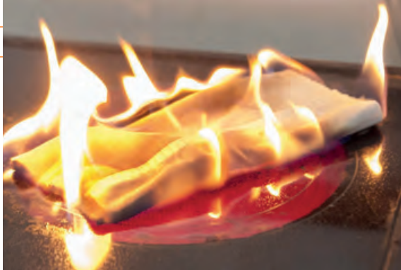
Eine der häufigsten Ursachen für Feuer in der Küche: Ein Handtuch, das auf einer eingeschalteten Herdplatte liegt