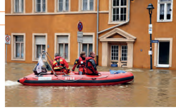
Rettungshelfer beim Hochwasser in Halle, Sachsen-Anhalt, 2013