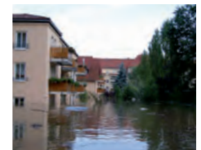
Hochwasser in der Stadt