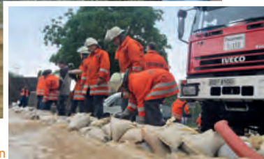
Schutzwälle aus Sandsäcken