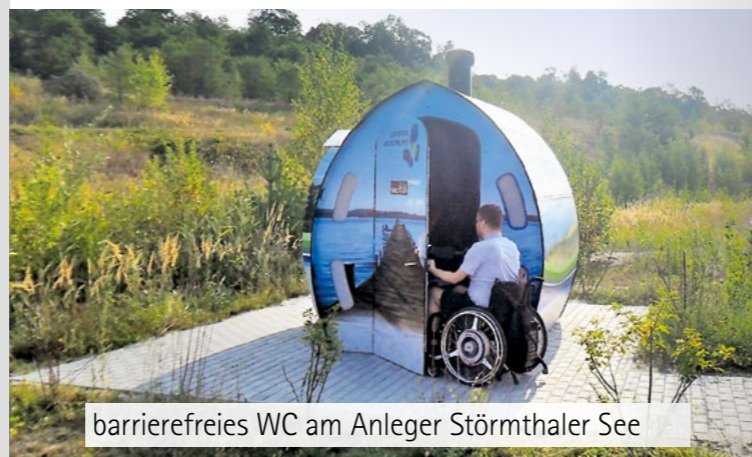
barrierefreies WC am Anleger Störnthaler See