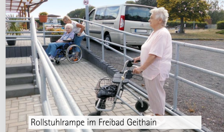
Rollstuhlrampe im Freibad Geithain

Nach Ausreichung der Förderbewilligung können Sie Ihr Vorhaben umsetzen – spätestens bis Ende des Bewilligungsjahres! Denken Sie bitte für den Verwendungsnachweis auch an schöne Vorher-Nachher-Bilder.