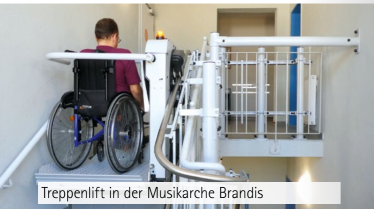
Treppenlift in der Musikarche Brandis